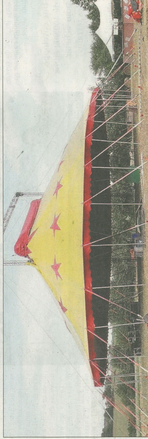
IDÉE. Un chapiteau de 567 m 2 , d'une capacité de 600 places, pourra accueillir les concerts et toutes les formes de spectacles.

Ce projet, c'est celui de créer un nouveau lieu culturel sur le territoire, dont la particularité sera d'être doté d'un grand chapiteau. D'une capacité de 600 places, avec tout l'équipement professionnel et le confort d'une salle de spectacle, il permettra à toutes les disciplines artistiques de se croiser en accueillant aussi bien des concerts que des spectacles pour enfants, du cirque ou encore du théâtre. Et ce n'est pas tout : accueil de résidences artistiques, de stagiaires, de scolaires, de centres de loisirs et même de clubs de lecture ou de cinéma. « Nous voulons proposer un vrai lieu de culture, accessible à tous, et ouvert à toutes les formes artistiques », insiste Fabien Violleau,